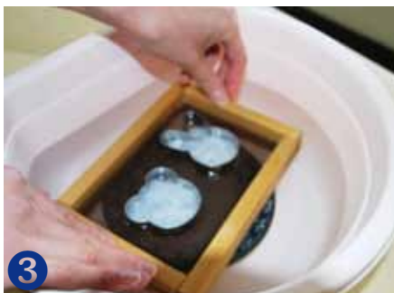
3 パルプ液を全体に流しこみます。すみまでキレイに入れてね！