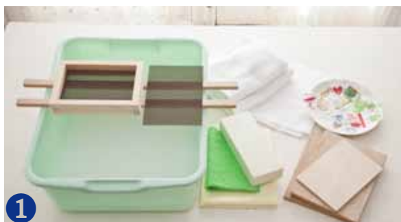
1 すきわくを2つ、あみ2枚、パルプ液を入れる容器、わたし棒2本を用意します。