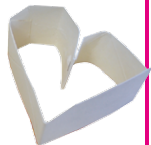
ハート型も作ってみたよ！