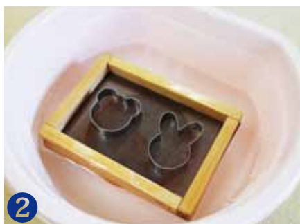
2 あみをはさんだすきわくに、すきな型をおきます。