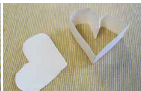
くふうして牛乳パックでいろいろな形を作ってみよう！