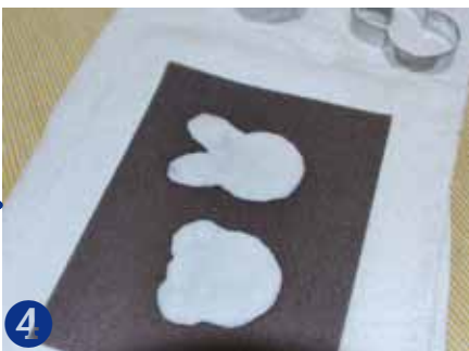
4 わたし棒の上にすきわくをのせて、水をきってから、型をゆっくりはずします。