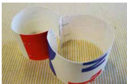
ゆきだるまの形を作ってみたよ！